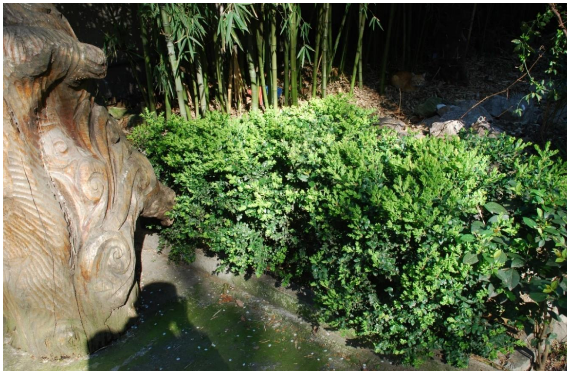
Рис. 4. Стриженный бордюр самшита колхидского в партере научного отдела СНП