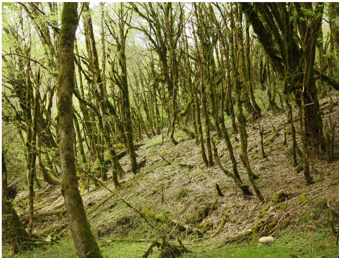
Рис. 2. Уничтоженный огнёвкой самшитник в бассейне реки Сочи, Верхне-Сочинское участковое лесничество СНП

Новороссийске, Краснодаре, Армавире, Майкопе и других населённых пунктах Краснодарского края и Республики Адыгея, а также в Республике Северная Осетия – Алания (Самшит..., 2016; Доброносков, 2016).