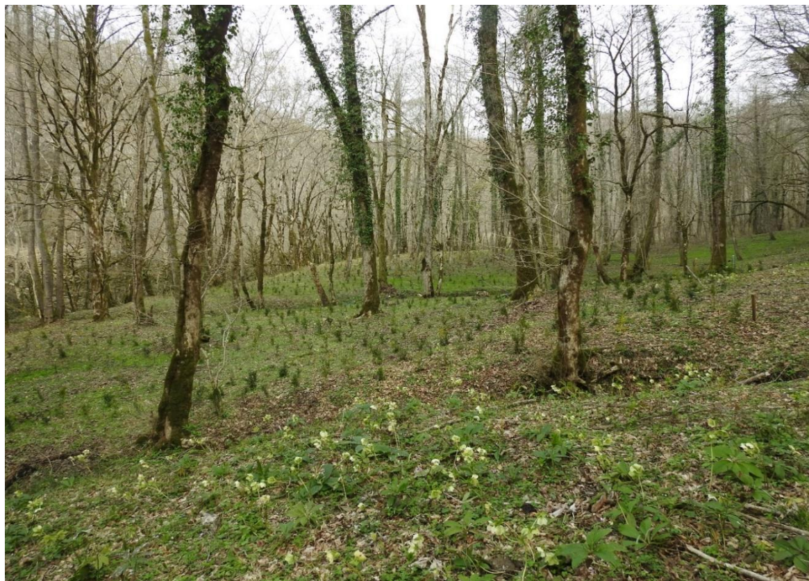
Рис. 8. Культуры самшита в Головинском участковом лесничестве СНП

В Дагомысском лесничестве растения были высажены на двух участках, общей площадью 0,3 га: большая – в глубине ущелья реки Восточный Дагомыс, меньшая – на территории рекреационного объекта «Водопад Дм Дм Бон». Мониторинг состояния реинтродуцированных культур показал 90 % приживаемости, саженцы успешно