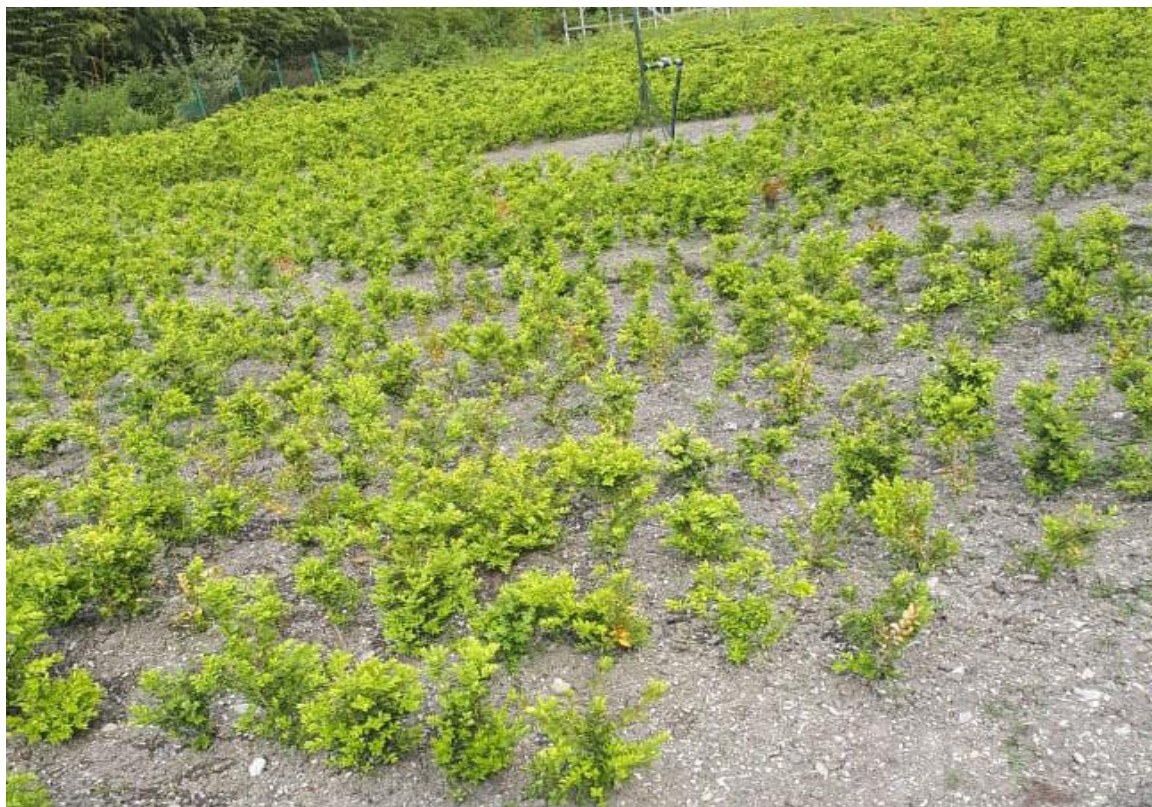
Рис. 6. Доращивание саженцев самшита в открытом грунте питомника СНП