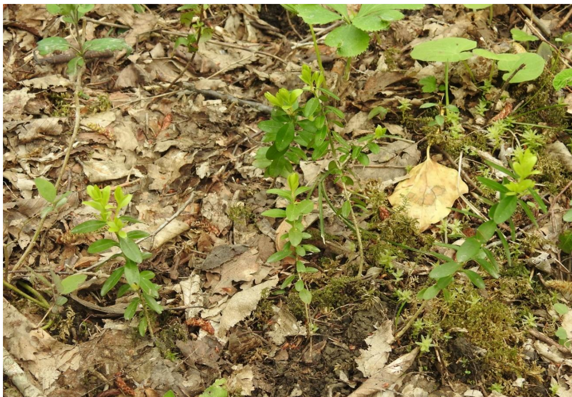
Рис. 7. Двухлетние сеянцы самшита, взшедшие в 2020 году из семян, пролежавших в почве 7 лет