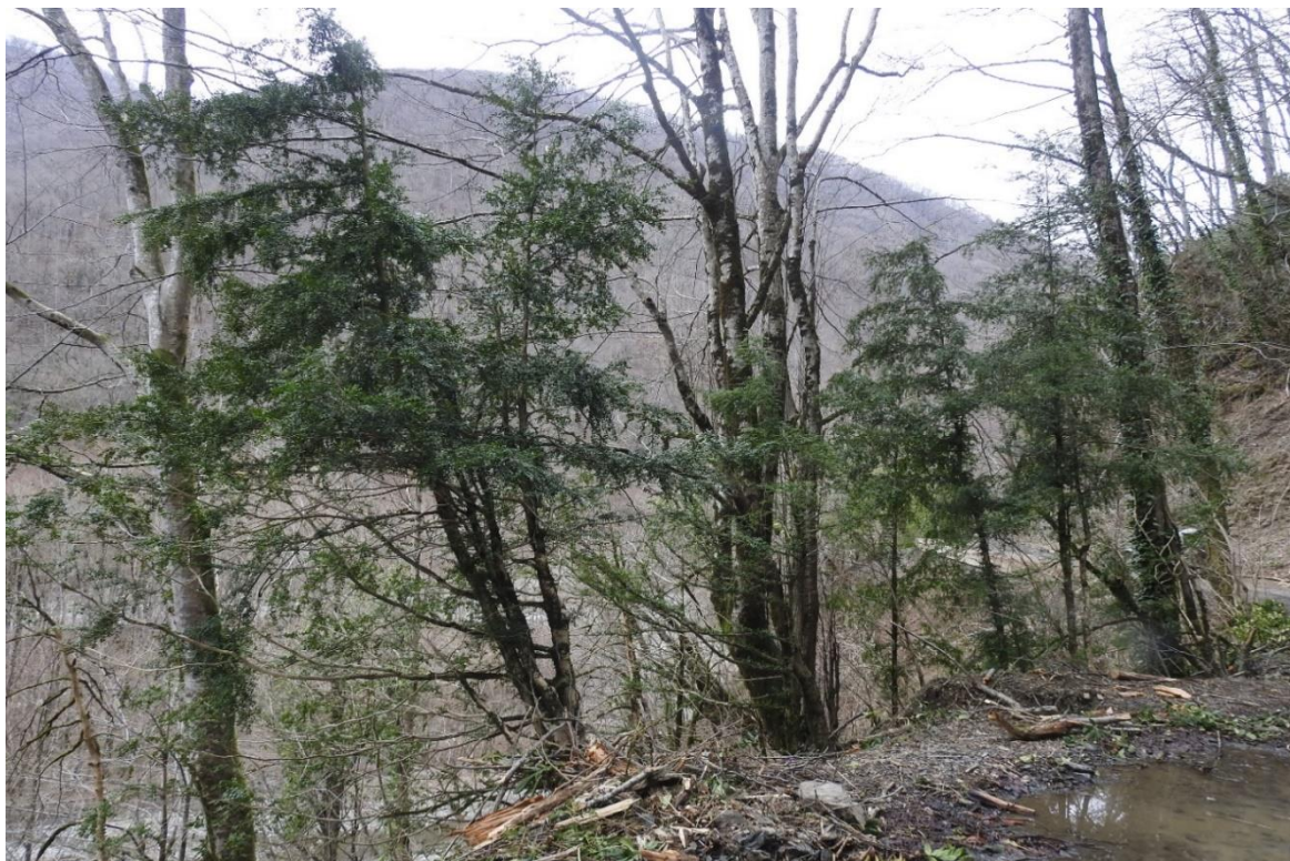
Рис. 3. Сохранённые участки в местах обработки самшита споровым суспензионным концентратом аборигенного вида энтомопаразитического гриба в ущелье реки Шахе, Солох-Аульское участковое лесничество СНП