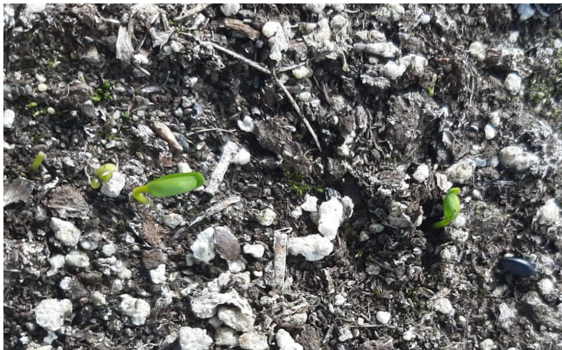
Рис. 5. Всходы семян самшита в теплице питомника СНП

путём черенкования в питомнике. В общей сложности в 2020 году было высажено 17358 экз. этого реликтового дерева. В 2021–2022 годах общее количество высаженных саженцев достигло 27358 экз. (табл. 1). Очередные 5000 саженцев выращено для посадок в 2023 году, причём впервые посадки запланированы в Аибгинском участковом лесничестве, где самшит произрастал на верхнем высотном пределе распространения в ущелье реки Псоу.