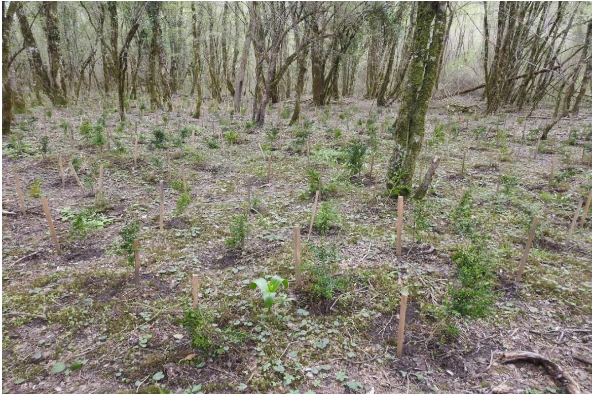
Рис. 9. Культуры самшита в Марьинском участковом лесничестве СНП

перезимовали, состояние большинства растений оценено удовлетворительным. У единичных экземпляров после холодной зимы наблюдался хлороз листьев. На отдельных саженцах черенкового происхождения наблюдалось начало цветения.