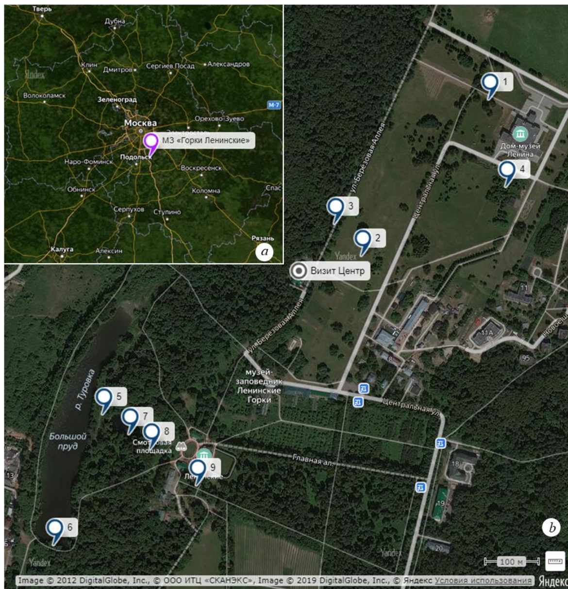
Рис. 1. Местоположение музея-заповедника «Горки Ленинские» (а) и пункты сбора лишайнологических материалов в парке (б)

кислотности субстрата: ацидофилы поселяются на субстратах с pH=3-4,5 ; нитрофилы заселяют субстраты с избытком азота и pH>4,5-6 ; нейтрофилы обитают на субстратах без избытка азота и pH>4,5-6 ; эвритопные встречаются на субстратах различной кислотности ( pH 3-6 ). Для определения видового богатства лишайнобиот рассчитан индекс Менхиника (Леонтьев, 2008).