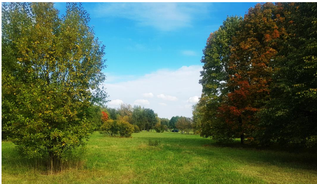
Рис. 2. Пункт 2. Посадки на территории перед Визит-центром парка музея-заповедника «Горки Ленинские»

В конспекте приняты следующие обозначения: «*» – вид новый для Московского региона; «+» – близкие к лишайникам нелихенизированные грибы; «!» – индикатор биологически ценных лесных и парковых сообществ; МР – Московский регион; АО – административный округ; ГО – городской округ; МЗ – музей-заповедник; МУ – музей-усадьба; ГПЗ – государственный природный заказник; ГПБЗ – государственный природный биосферный заповедник; окр. – окрестности.