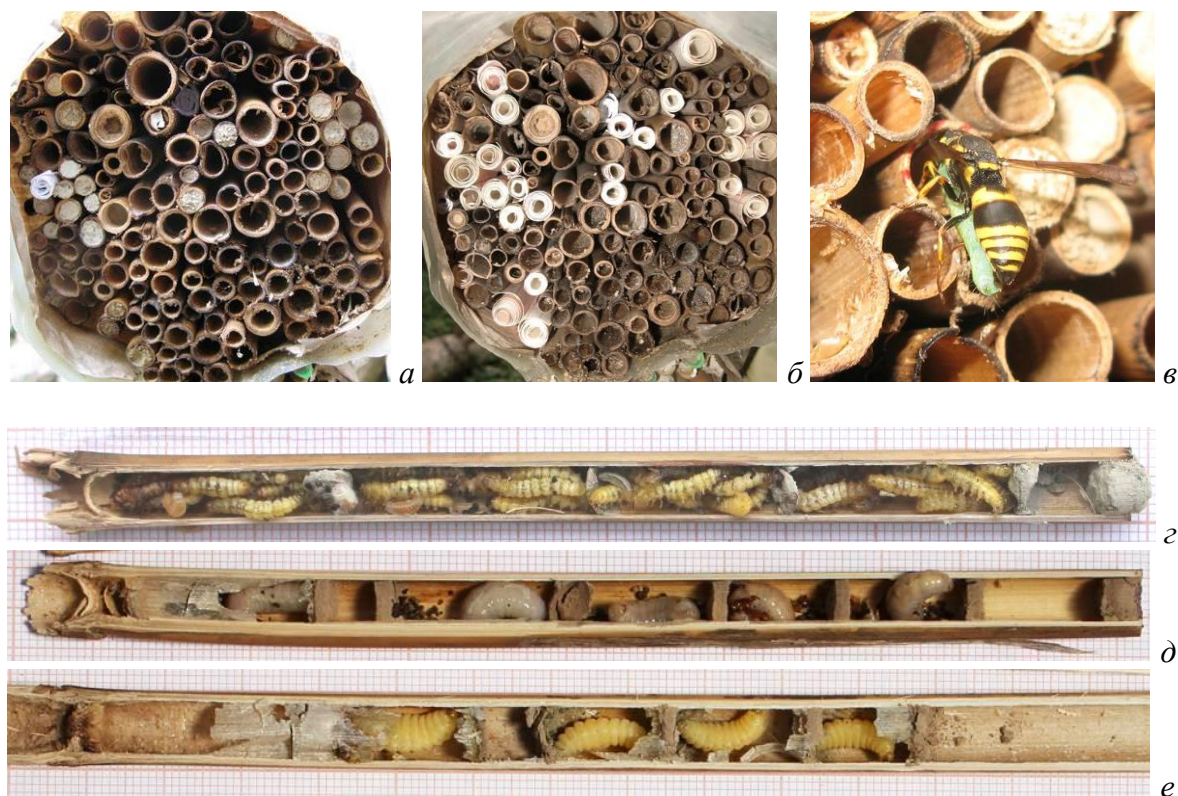
Рис. 5. Контроль за ходом гнездования Euodynerus posticus

Гнездовые блоки ульев Фабра – видны пробки запечатанных гнезд (а) и бумажные скрутки, вставленные на место изъятых гнезд (б); самка осы заходит в гнездо с очередной жертвой (в); вскрытые в один день (17.07.15) гнезда E. posticus разных сроков закладки: свежезапечатанное гнездо с парализованными гусеницами (г), гнездо с личинками только что закончившими питание (д), гнездо с предкуколками ос (е).