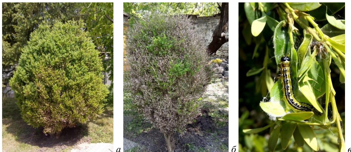
Рис. 3. Характер поражения самшита огневкой Cydalima perspectalis

Своеобразие поражения самшита огневкой состоит в том, что в первый год очаги поражения малозаметны (рис. 3 а), но уже на следующий – дерево или куст могут полностью лишиться листвы (рис. 3 б).