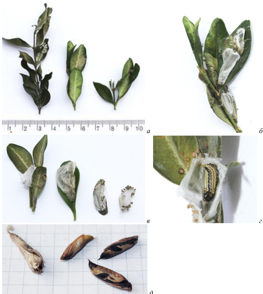
Рис. 2. Прохождение стадий развития Cydalima perspectalis третьей генерации

а – следы питания гусениц первых возрастов; б, в – зимовочные коконы; г – вскрытый зимовочный кокон с гусеницей; д – куколки (все фотографии сделаны 06.11.15).