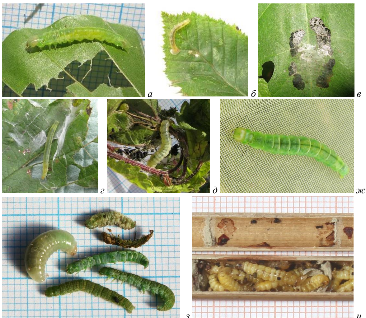
Рис. 6. Разнообразие жертв ос Euodynerus posticus

a и б – гусеница второго поколения многоядной листовертки Pandemis heparana ([Denis & Schiffermüller], 1775) – вредителя многих древесных пород на пораженном ею листе бука ( a ) и граба ( б ); в – инжирная моле-листовертка Choreutis nemorana (Hübner, [1799]) (семейство моле-листоверток Choreutidae) – специализированный вредитель инжира; г – гусеница выемчатокрылой моли (Gelechiidae) на ежевике; д и ж – гусеницы P. heparana в своем гнезде на крапиве и гусеница, извлеченная из ячейки гнезда осы. з – гусеницы узкорылых огневок предположительно из рода Phycita (Phycitidae), извлеченные из ячейки гнезда осы вместе с личинкой осы; и – гусеницы листовертки P. heparana (первое поколение) в ячейке гнезда.