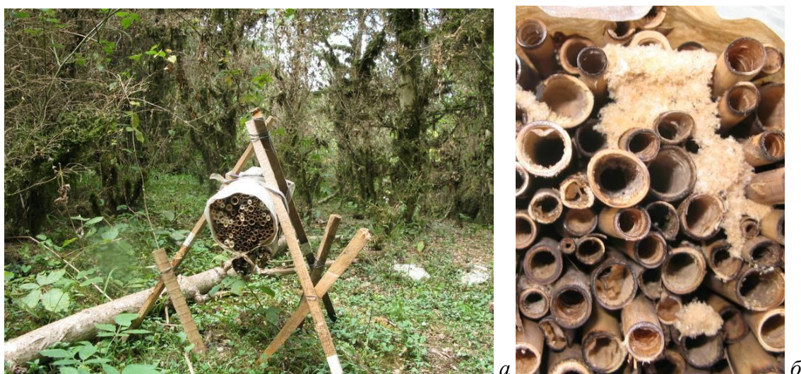
Рис. 4. Улей Фабра специальной конструкции, установленный в насаждениях самшита колхидского (а) и участок гнездового блока улья, заселенного муравьями (б)

Для поселения ос-энтомофагов в Сочинском национальном парке нами была разработана специальная конструкция улья Фабра (рис. 4 а) – легкая и прочная. Конструкция улья представляла собой треногу, в пересечении опорных реек которой закреплялся гнездовой блок улья – связка из 100–150 нарезанных на длину 25–30 см отрезков стеблей тростника ( Phragmites australis ). Внутренние полости стеблей ограниченных узлами стебля предназначались для постройки гнезд самкам E. posticus . Подселение ос в ульи осуществлялось в три срока: 16–21.04.15, 28–30.04.15 и 28–31.05.15 (рис. 1). В первые два подселения были использованы материнские гнезда в количестве 65, выдержанные в течение 11–22 дней в термостате. В большинстве случаев (185 подсадных гнезд) использовались гнезда, развитие преимагинальных стадий в которых проходило при естественных температурах. Всего между 8-ми ульями было распределено 280 подсадных гнезд, содержащих 1125 ячеек: 337 ячеек с самками, 663 – с самцами и 125 ячеек с погибшими по разным причинам особями. Количество особей рассчитывалось на основании выхода ос из контрольной партии. Исходя из этих расчетов, в каждый улей Фабра было посажено около 42 самок E. posticus .