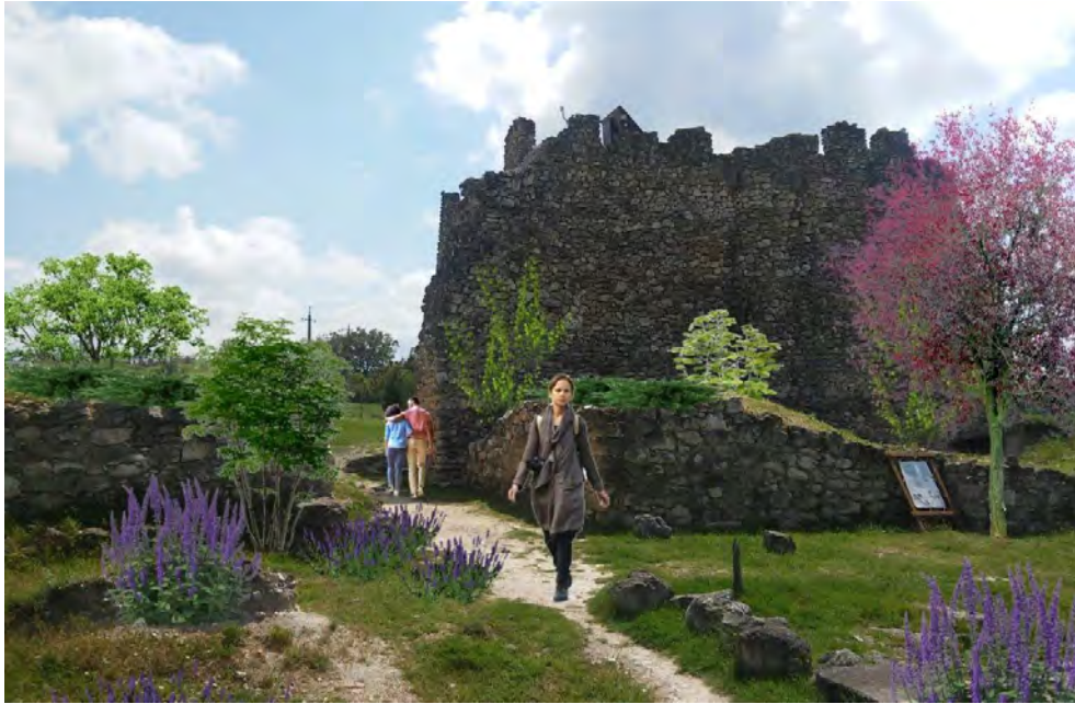
Рис. 4. Эскиз благоустройства и озеленения зоны раскопок

Скифы – степной кочевой народ. Поэтому в проекте реконструкции, главным образом, должен быть задействован семантический аспект. Историческая семантика заповедника не предполагает в озеленении территории использование древесно-кустарниковых групп, массивов, рядовых посадок (помимо территории за охранной зоной и мест консервации) в соответствии с нормативной базой, принятых для других объектов ландшафтной архитектуры. В этой связи мы исходили из идеи минимального вмешательства в существующий природный ландшафт, использования дикорастущих растений. Ассортимент включает как аборигенные виды крымского Предгорья, так и произраставшие ранее на плато по свидетельствам историков (рис. 4).