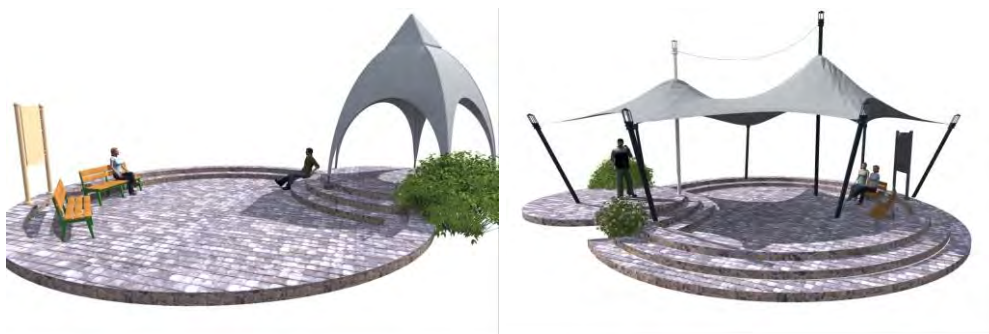
Рис. 5. Примеры мобильных конструкций шатров

Чтобы максимально выгодно использовать визуальные связи территории, нами предлагается размещение на обрывах у восточной границы площадок с применением легких, мобильных шатров, которые будут стилизованы под скифский период (рис. 5).