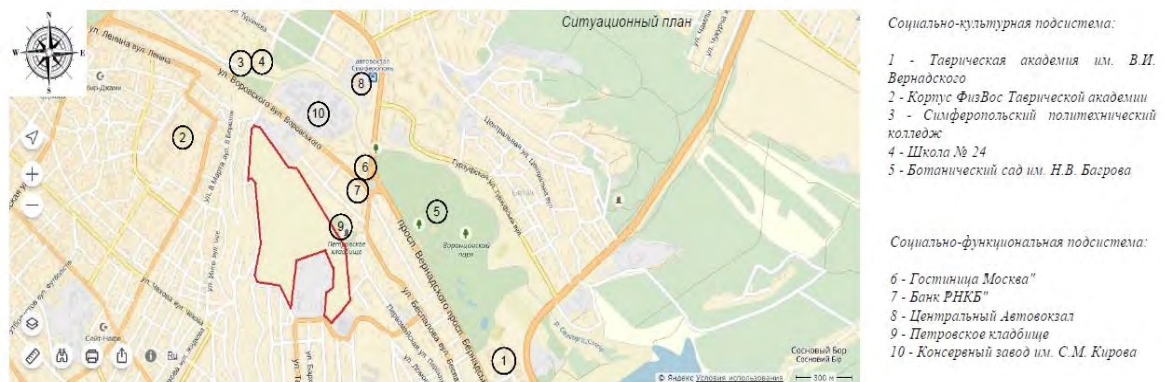
Рис. 1. Расположение историко-архитектурного заповедника «Неаполь Скифский» в системе планировки города

На всех улицах есть доступ общественного транспорта. Объект практически со всех сторон окружен жилой застройкой. Со стороны ул. Батаева и Неапольской – малоэтажной частной застройкой комбинированного характера; со стороны ул. Алуштинской – малоэтажной частной застройкой строчного характера; со стороны ул. Первомайской располагается жилой массив группового характера (рис. 1).