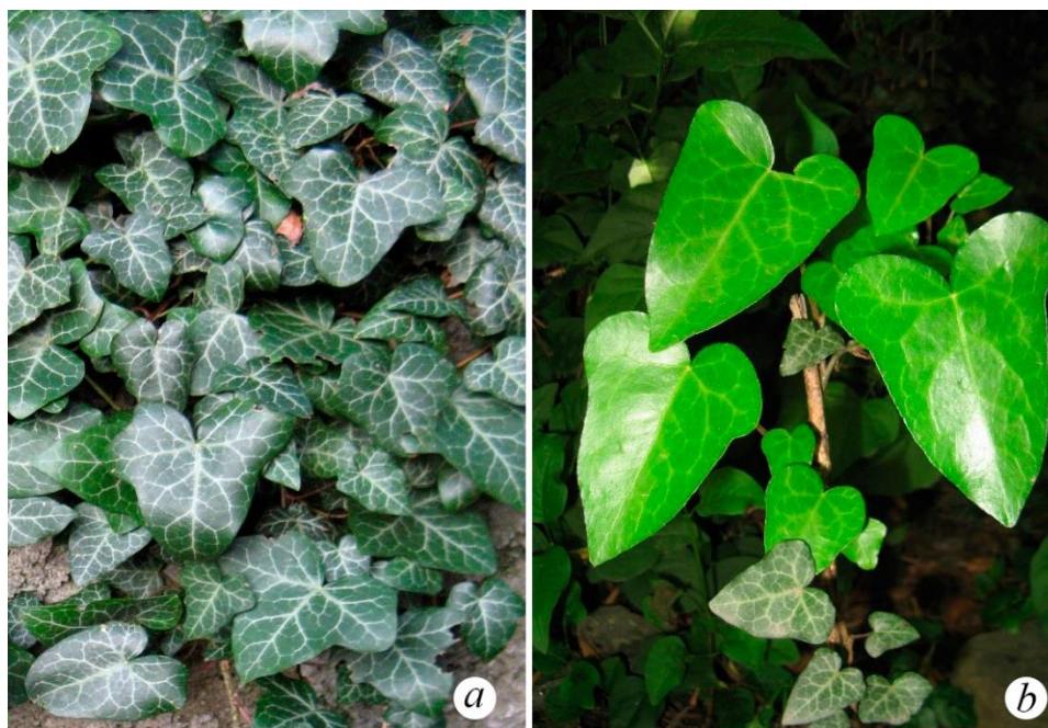
Рис. 2. Отклонения формы листьев от сортового стандарта Hedera hibernica 'Scutifolia' у особи, растущей на подпорной стене в Никитском ботаническом саду (а), и двухлетняя особь Hedera hibernica 'Scutifolia' в коллекции автора (b)

климатические экстремумы, конкурентное вытеснение другими растениями или плановая ликвидация – иногда сохраняются единичные фрагменты побегов этих вегетативно-подвижных растений. Таковыми могут оказаться, к примеру, наиболее устойчивые клоны, или побеги, сохранившиеся в труднодоступных местах (например, в щелях каменной кладки подпорных стен), или же оставленные по недосмотру.