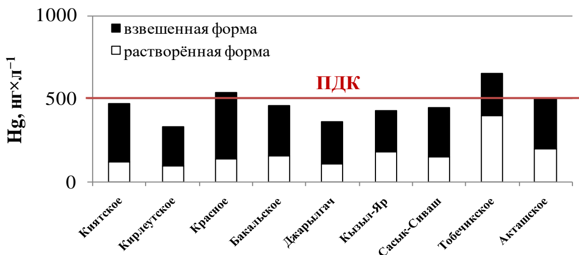
Рис. 3. Содержание общей (суммарной) формы ртути в соленых озерах Крыма

Содержание растворенной, взвешенной и общей (суммарной) форм ртути в воде изучаемых объектов представлено на рисунке 3.