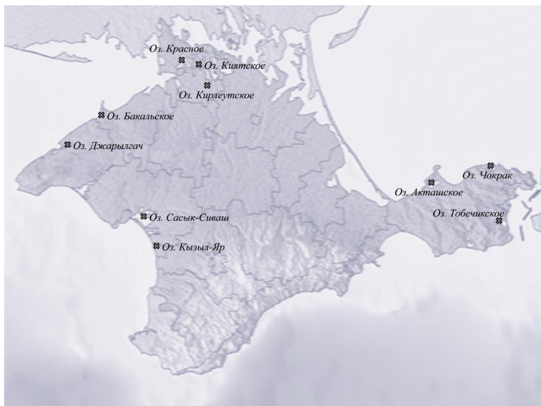
Рис. 1. Карта-схема отбора проб в соленых озерах Крыма

Для разделения форм ртути отобранные пробы воды фиксировали на месте отбора концентрированной азотной кислотой (10 мл \text{HNO}_3 на 1 л воды) и уже в лаборатории пробы воды фильтровали через предварительно взвешенные нуклеопоровые фильтры с диаметром пор 0,45 мкм. В фильтрате анализировали растворенную форму ртути, а на фильтрах – взвешенную.