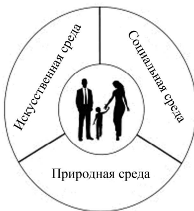
Рис. 3. Положение социума в пространстве трех сред

Для наглядного представления о среде, окружающей человека, воспользуемся известным логотипом фирмы «Mercedes-Benz», поместив в его центр иерархическую пирамиду человеческого социума. В результате положение социума в пространстве трех сред имеет вид, изображенный на рисунке 3.