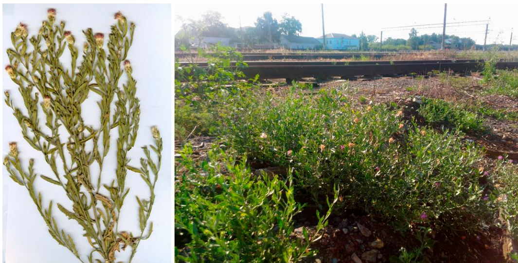
Рис. 2. Гербарный экземпляр и цветущие растения Acroptilon repens на откосе железнодорожных путей (ценопопуляция Кумертау)

acanthoides L., Berteroa incana (L.) DC., Lactuca serriola L., Cichorium intybus L. и другие. На данные ценозы оказывается сильное антропогенное воздействие преимущественно за счет регулярного скашивания и прополки в пределах железнодорожных путей.